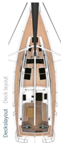
Deckslayout Deck layout

Whether in the 2- or 3-cabin version – the BAVARIA VISION 46 distinguishes itself with its intelligent spatial concept.