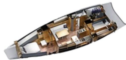
2-Kabinen-Layout 2-cabin layout