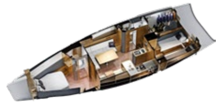
3-Kabinen-Layout 3-cabin layout