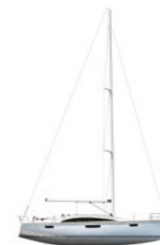
BAVARIA VISION 42 Page 08

The name speaks for itself. The concept, developed in collaboration with Farr Yacht Design, is particularly attractive for owners who wish to stay on board far longer than just a weekend. The asymmetric layout of the companionway facilitates a completely new layout featuring many innovative details.